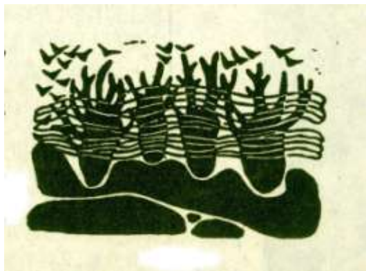
图 1 检材