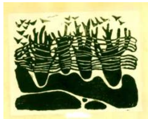
图 2 样本一