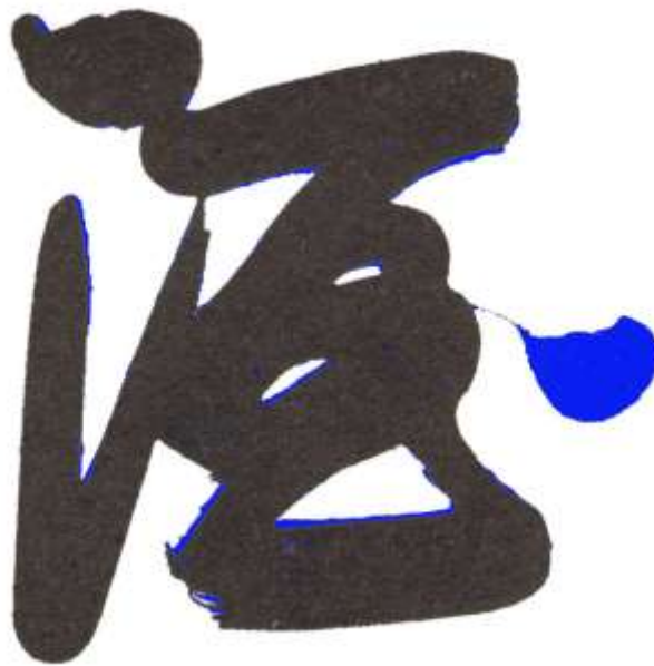
图 12 酒标二和样本二（蓝色）重合比对