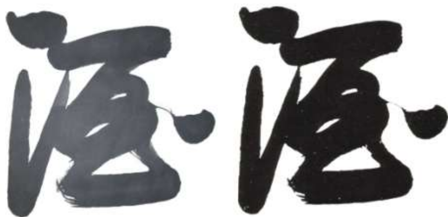
图 9 左侧为样本一、右侧为样本二