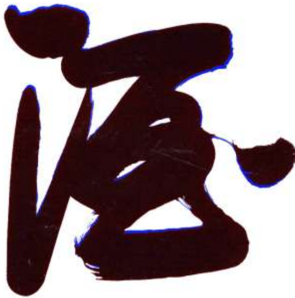
图 11 酒标一和样本一（蓝色）重合比对