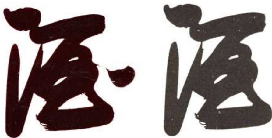
图 8 左侧为酒标一、右侧为酒标二