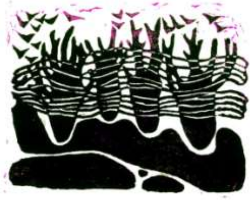
图 5 样本一和样本三重合比对