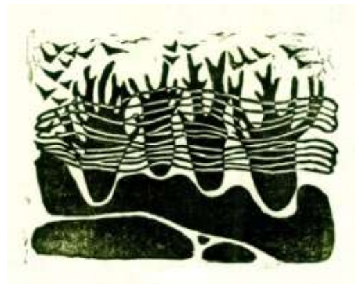
图 4 样本三