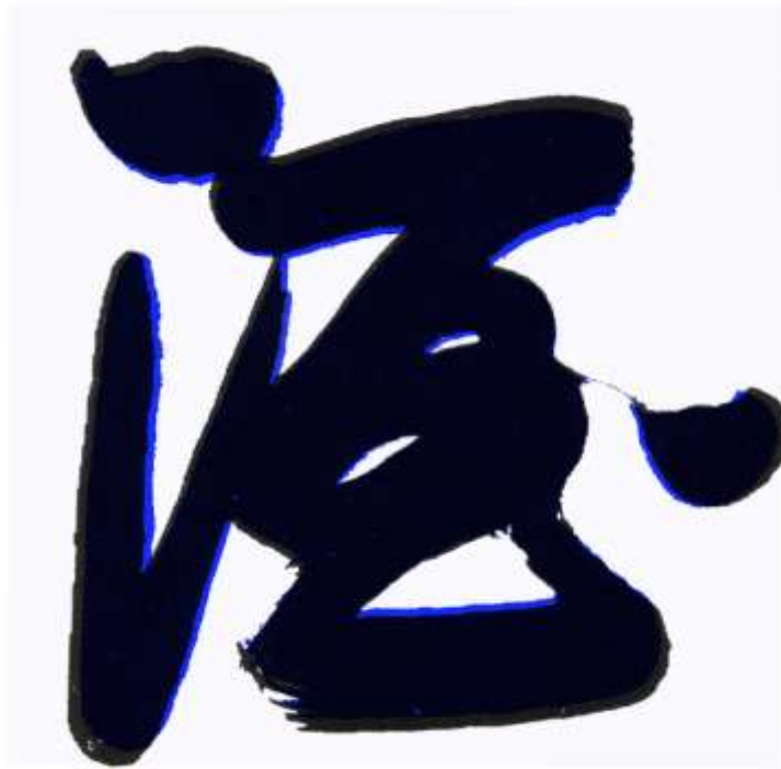
图 10 样本一和样本二（蓝色）重合比对