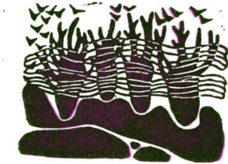
图 7 检材和样本二重合比对