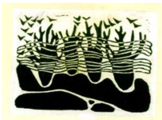
图 3 样本二